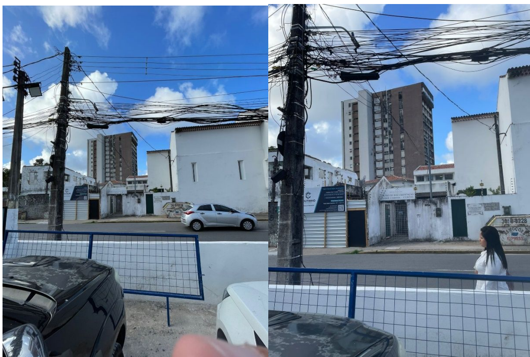
Figura 3 – Registro Fotográfico da situação atual.

Nas imagens a seguir é possível observar a situação atual em que se encontra o terreno.