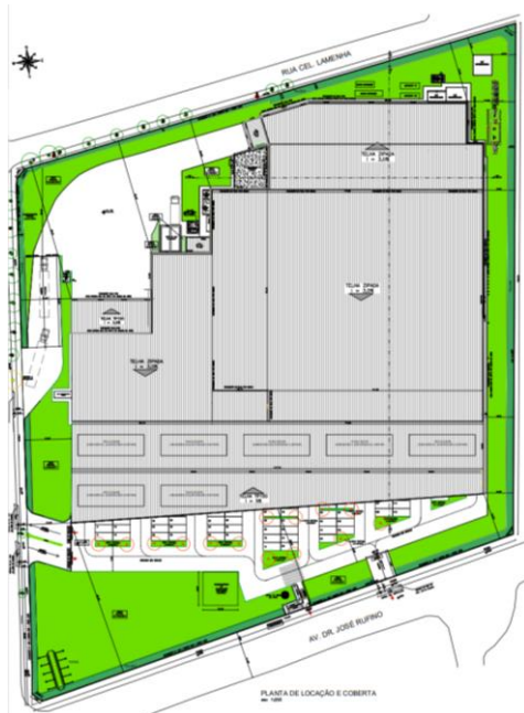
Fig. 01 – Planta de Locação e Coberta.

A autora do projeto anexou Memorial Justificativo solicitando a substituição do telhado verde por telhado fotovoltaico ou “painéis solares na coberta do estacionamento”, uma vez que estes cumprem a sustentabilidade climática, evitando ilhas de calor, captando águas das chuvas e enviando-as aos tanques de retardo.